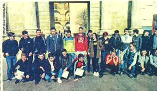
Erasmus+ akreditaciju valpovačka je srednja škola dobila za strukovno obrazovanje