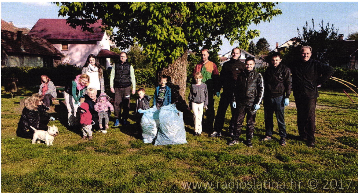
Slika 1. Zelena čistka -21.04.2017.

DND Slatina i Gradski savjet mladih u okviru akcije "Zelena čistka" očistili parkić u ulici Ljudevita Jonkea.