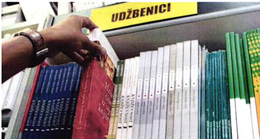
Slika 6. Udžbenici

Članovi Savjeta mladih Grada Slatine pripomogli su oko organizacije udžbenika 05. i 06. srpnja 2017.