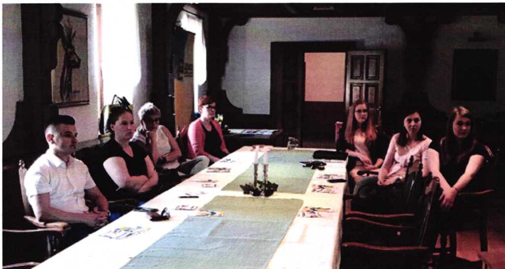
Slika 5. Đakovo, 10. lipnja 2017. CLLD metodologije